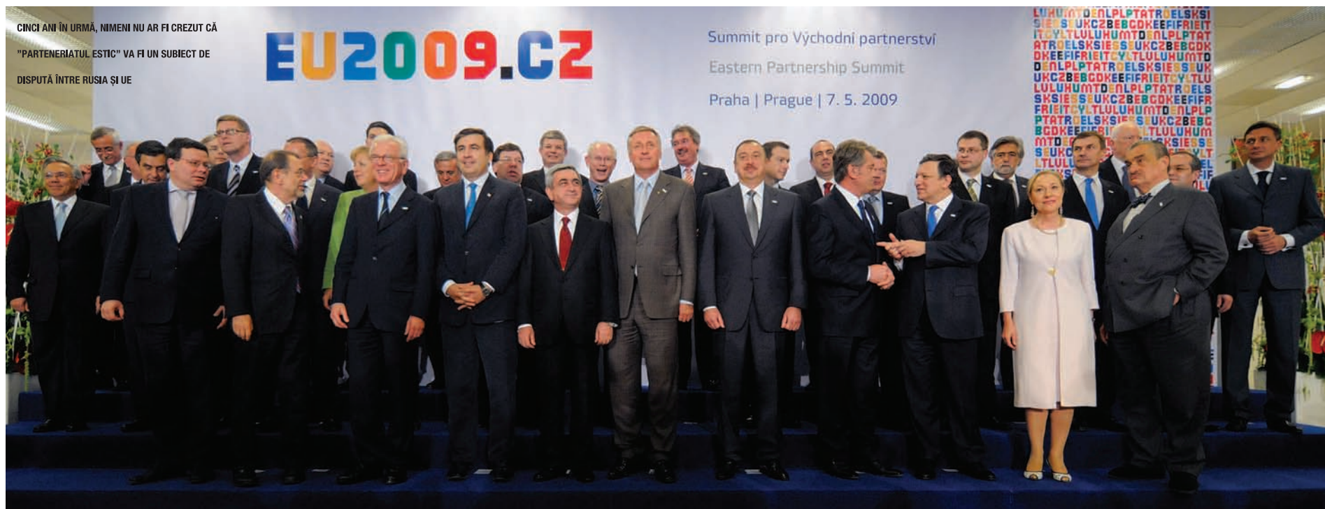
CINCI ANI ÎN URMĂ, NIMENI NU AR FI CREZUT CĂ "PARTENERIATUL ESTIC" VA FI UN SUBIECT DE DISPUTĂ ÎNTRE RUSIA ȘI UE

În mai a.c se vor împlini exact cinci ani din momentul adoptării în cadrul summitului de la Praga a declarației Uniunii Europene privind Parteneriatul Estic. Această zi este considerată oficial ziua de naștere a proiectului, care cuprinde șase țări post-sovietice: Azerbaidjan, Armenia, Belarus, Georgia, Moldova și Ucraina.